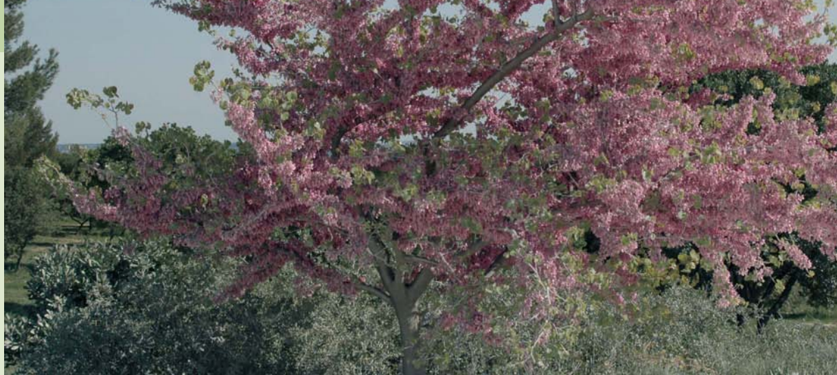
Arbre de Judée