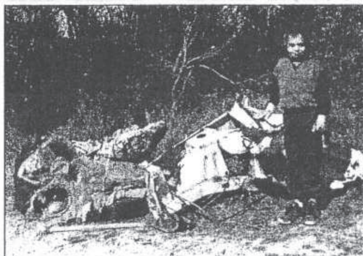
Il n'y a pas d'âge pour les braves !!!